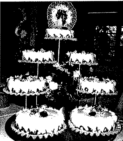
die Hochzeitstorte - eine der vielen Spezialitäten des Hauses